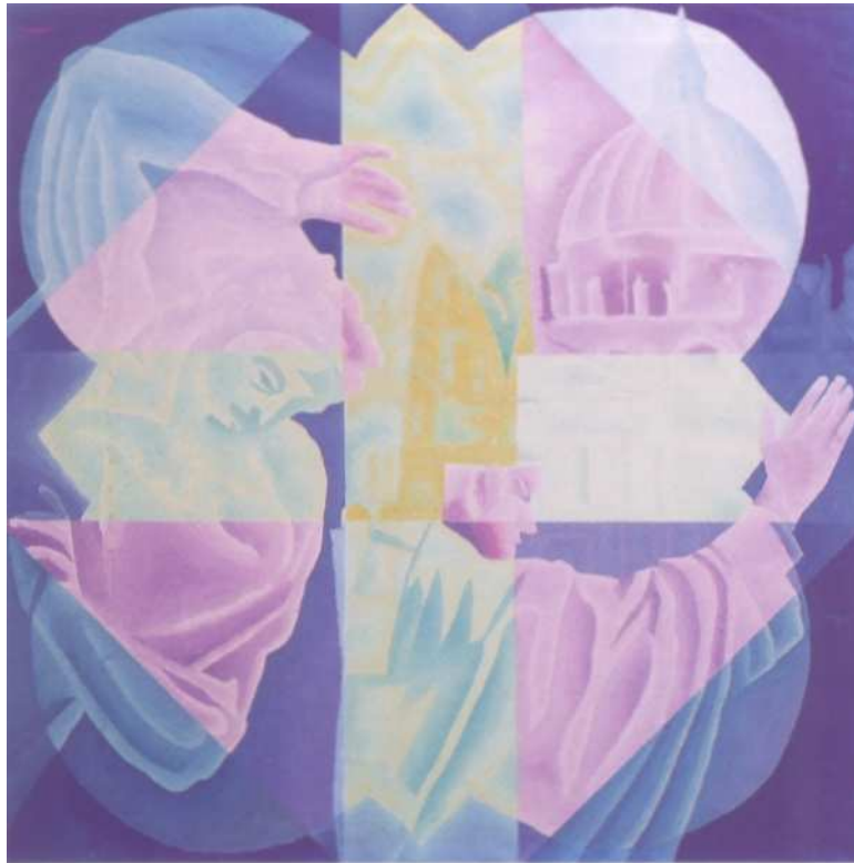
S.S. Giovanni Paolo II