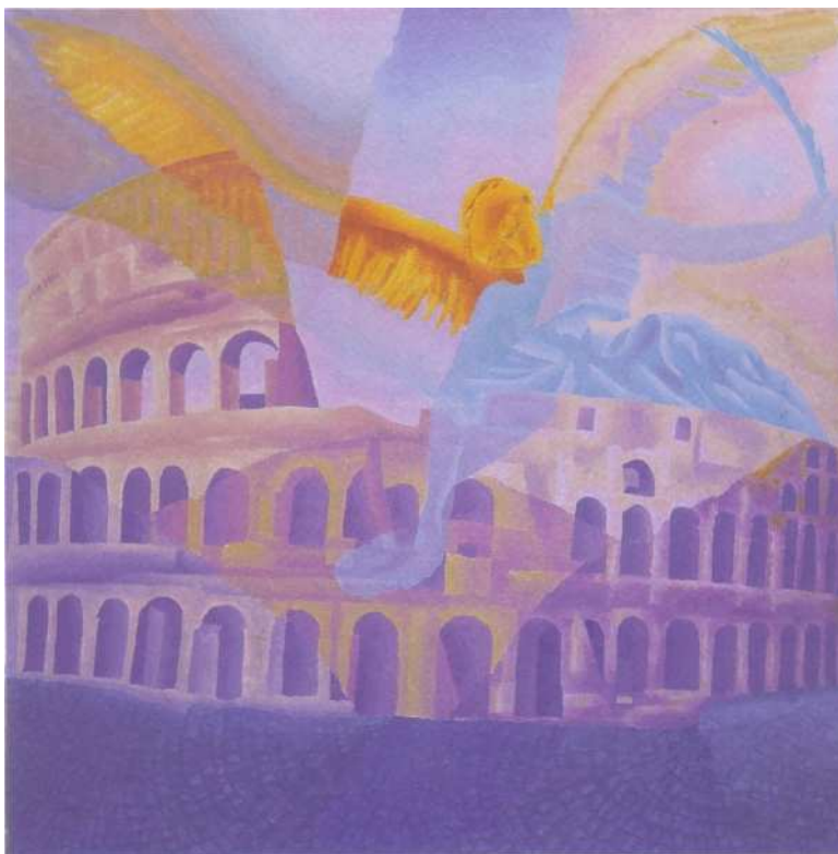
Roma era nuova