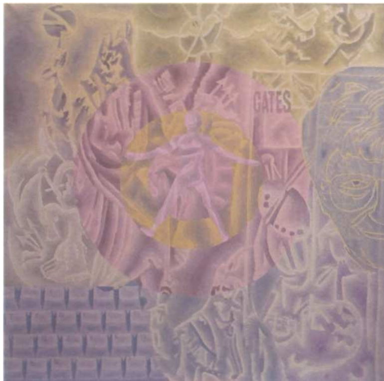
Dalla metafisica a Internet