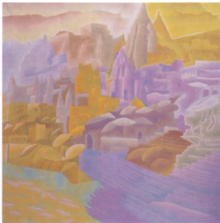
Benares città santa degli induisti e non solo